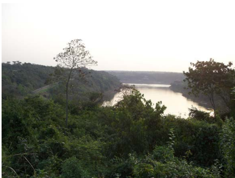
Граница Аргентины, Бразилии и Парагвая