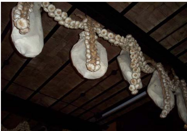
Копчёное мясо с чесноком – любимая еда аргентинцев