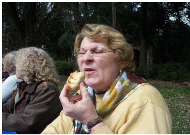
А это знаменитые эспанадос

Вечером первого же дня нас пригласили посмотреть ещё на два аргентинских бренда – танго и гаучо. Правда, это всё теперь только в туристическом варианте – в ресторанчиках Байреса, но, тем не менее, это было высокопрофессионально, даже несмотря на то, что мы уже страшно хотели спать. Сказывалась разница в часовых поясах.