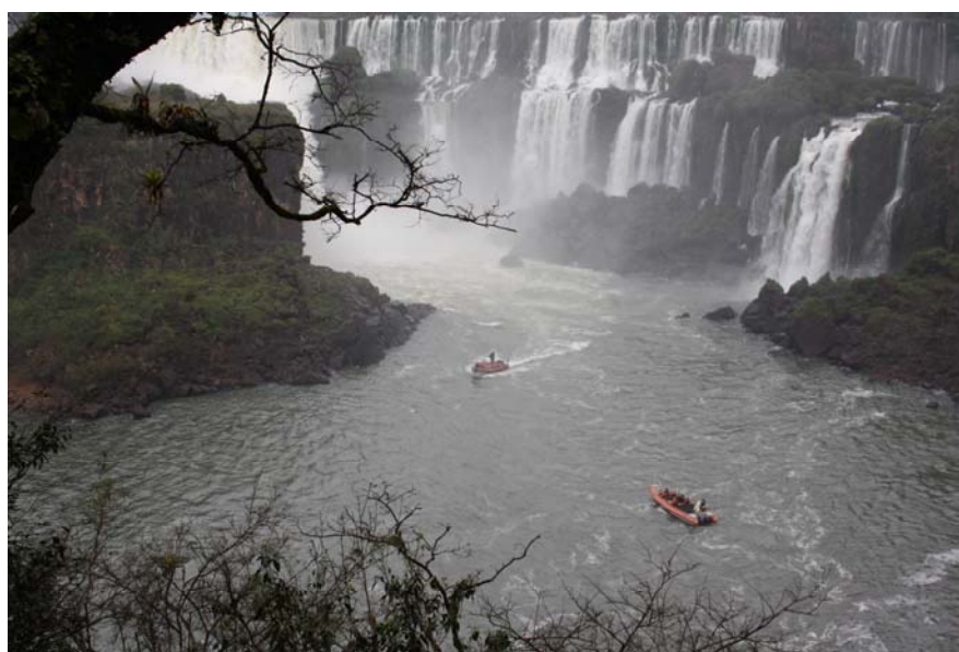
В панораме около 15 водопадов