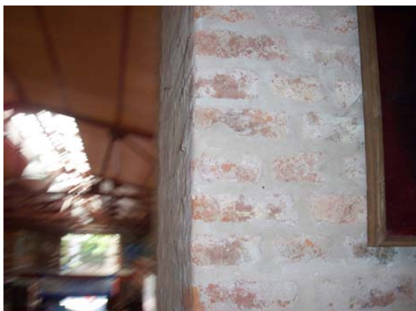
Интерьер Университета Кильмеса

Второй день был связан с поездкой в Университет Кильмеса в часе езды от нашей гостиницы. И вот там-то, по дороге мы и увидели аргентинское гетто. Мы не стали его снимать, это было зрелище не из приятных. Там живут и эмигранты последних лет, и те, кто потерял нормальную работу, и те, кто не хочет работать. Мы долго плутали в какой-то странной местности, было ощущение заброшенности во времени. Опытный водитель блуждал по Кильмесу и никак не мог найти университет. Да и само учебное заведение, когда мы туда наконец добрались, произвело странное впечатление. Оно расположено в брошенном здании завода, и его индустриальный интерьер достаточно своеобразен. Это маленький университет на 6000 студентов. Но принимали там нас очень доброжелательно.