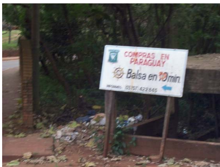
10 минут – и ты в Парагвае