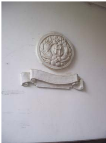
Экслибрис библиотеки гасиенды на её стене

На четвёртый день заключительное заседание конференции происходило на ферме, которая находится под покровительством Университета Буэнос-Айреса. Её построили в конце XVIII – начале XIX века, и потомки первых хозяев до сих пор владеют этой землёй. Помимо того что там выращивают огромных холёных быков, ферма является ещё и музеем-гасиендой с великолепной библиотекой старинных книг, которой пользуются в тиши сотрудники университета.