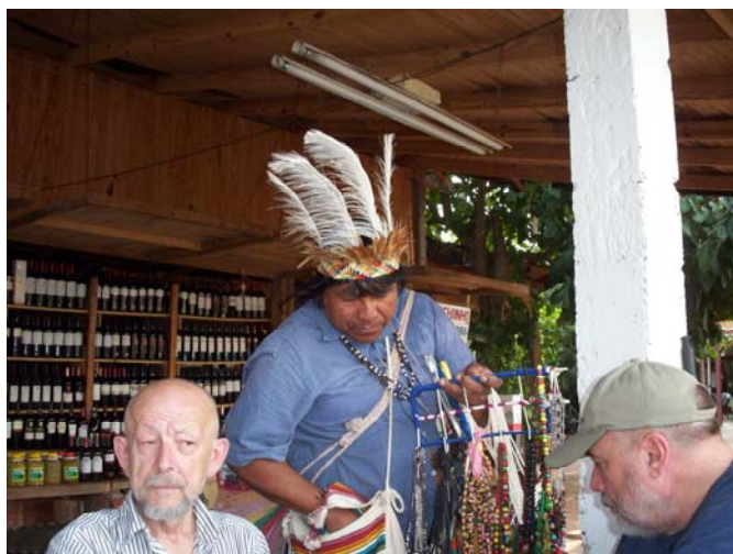
Индейцы продают экзотические поделки