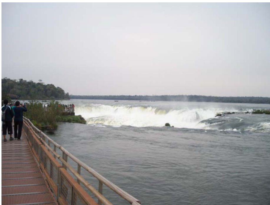
Так невинно выглядит сверху самый впечатляющий водопад каскада — Глотка дьявола