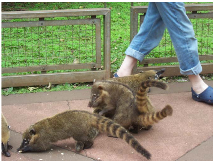
На территории заповедника симпатичные носухи бродят среди людей