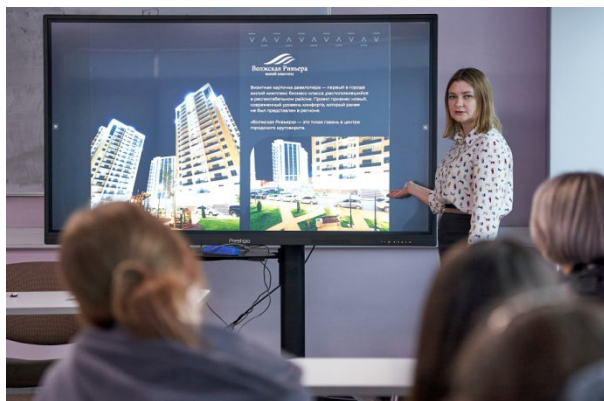
Встреча с работодателем