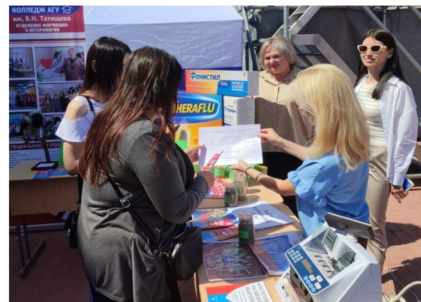
Выездные профориентационные мероприятия