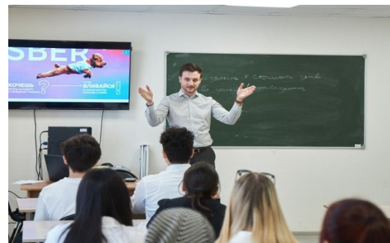
Мастер-класс «Собеседование и самопрезентация»