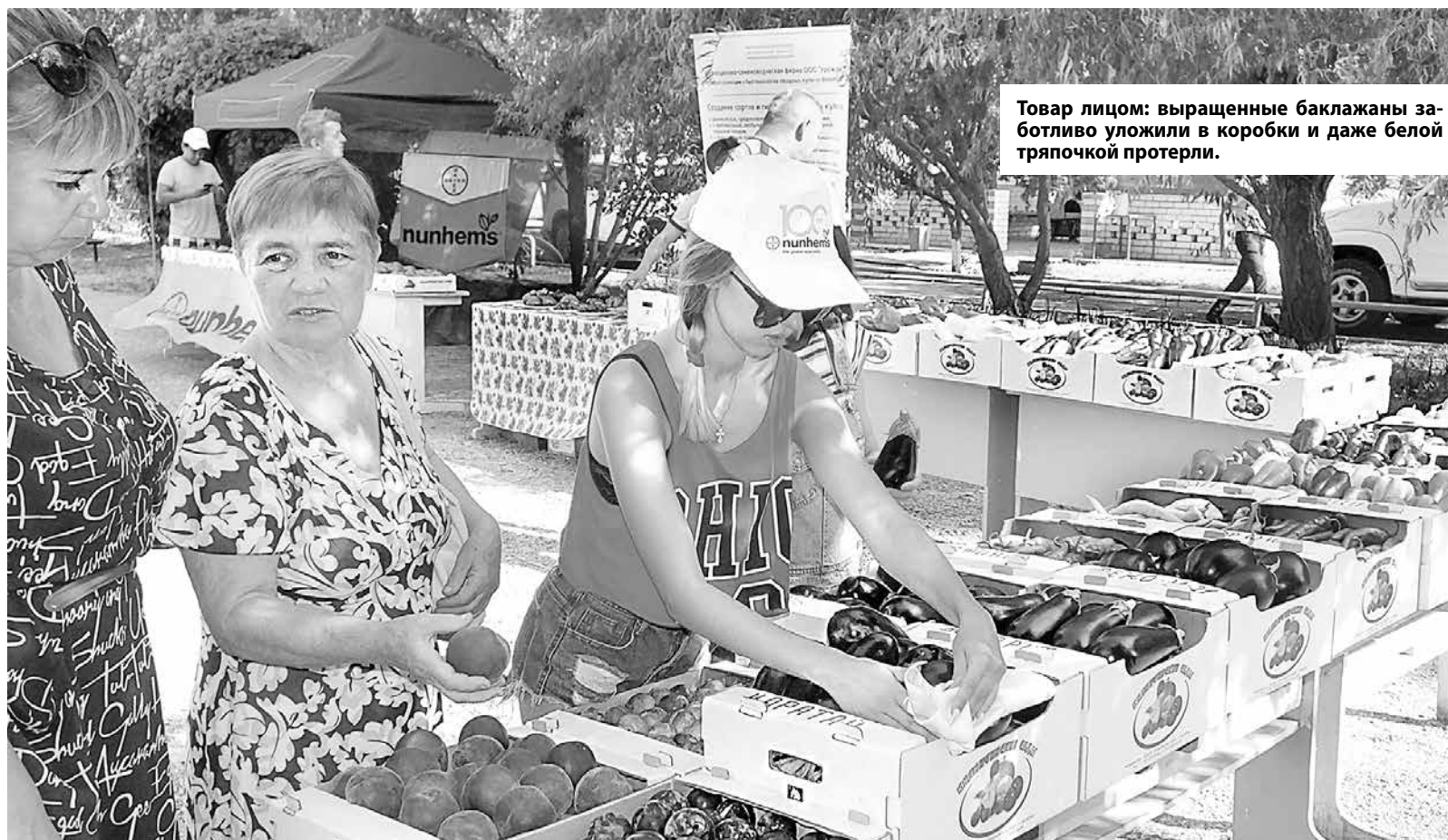
Товар лицом: выращенные баклажаны заботливо уложили в коробки и даже белой тряпочкой протерли.