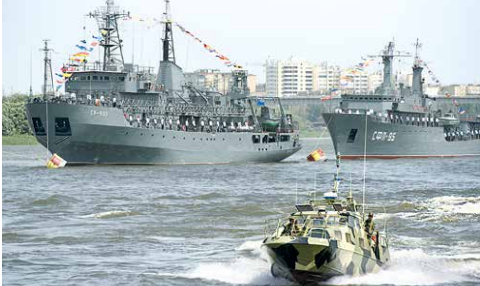
Перед парадом обновляют краску на боевых кораблях. Это ежегодный ритуал, начинающийся за месяц-полтора до часа икс. Приводят в идеальный вид и форму личного состава.