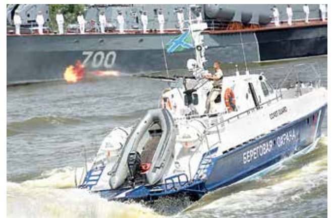
Обезвредить бандформирование, разминировать подходы, уничтожить средства воздушной разведки? Запросто!