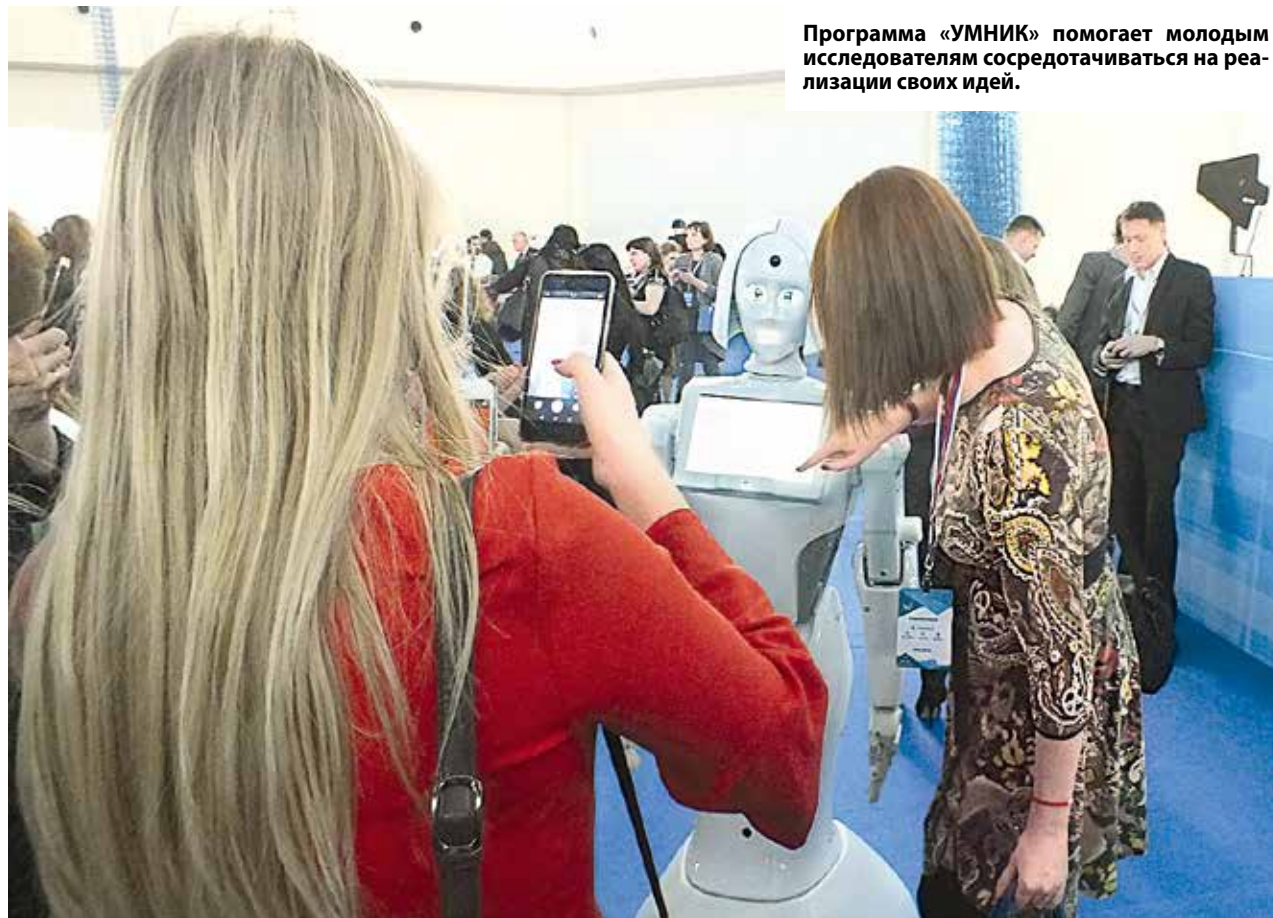
Программа «УМНИК» помогает молодым исследователям сосредотачиваться на реализации своих идей.