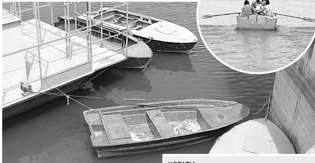
На таких утлых суденышках, без спасательных жилетов переправляются астраханцы на пляж. Цена жизни - 50 рублей.

Добраться до официального городского пляжа с Комсомольской набережной многие предпочитают по воде, с ветерком на лодочке.