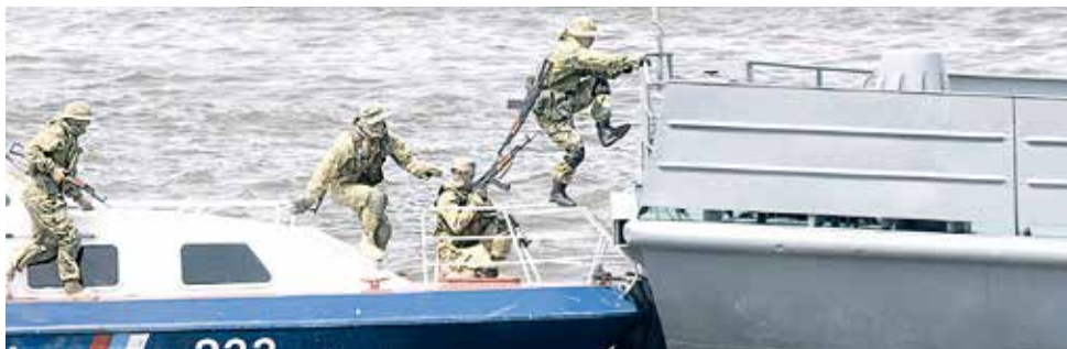
На военно-спортивном празднике все было как в настоящем бою - с перестрелками и дымовыми завесами. В ходе учебных спецопераций военные показали свои лучшие качества.