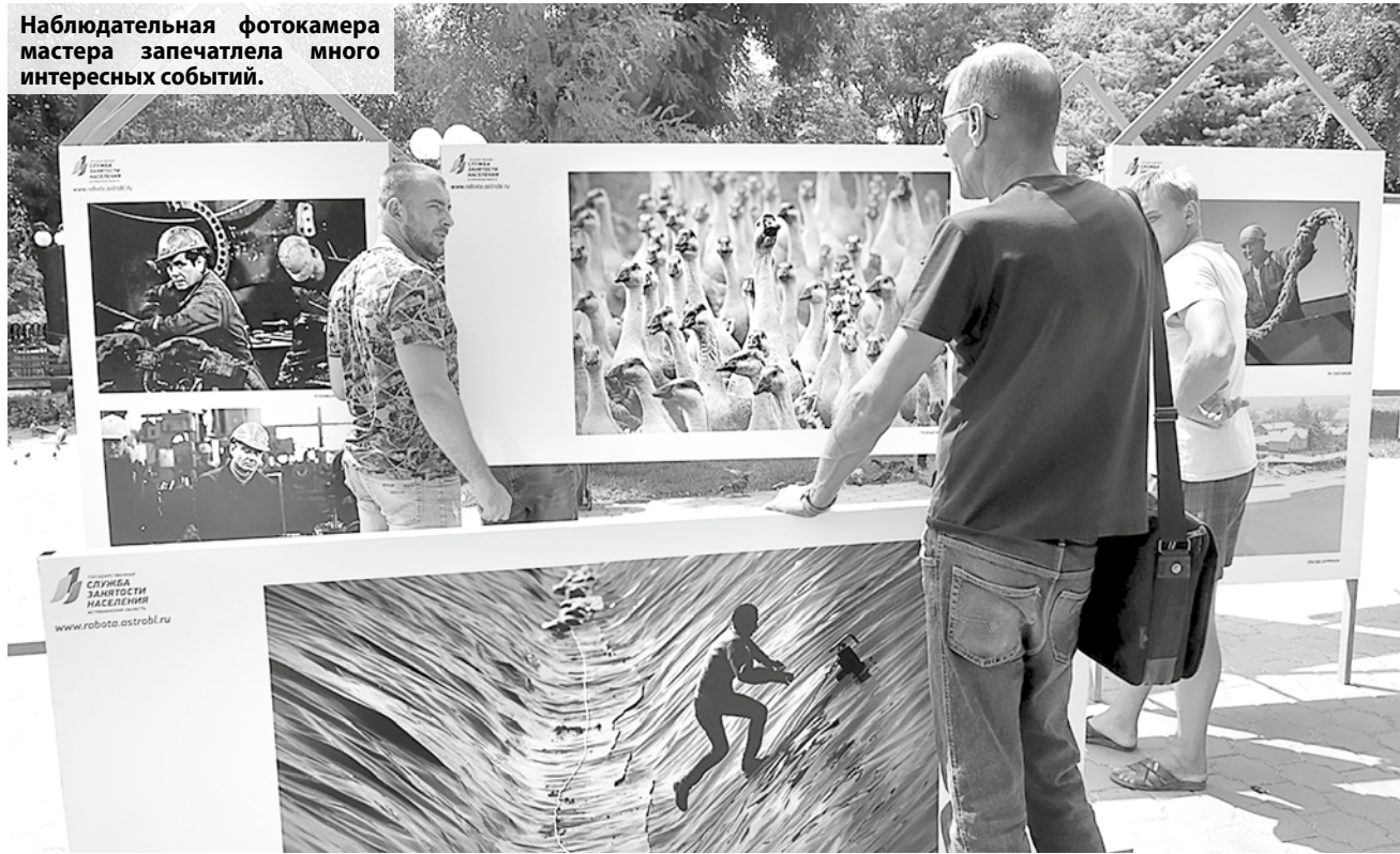
Наблюдательная фотокамера мастера запечатлела много интересных событий.

В Братском саду Астрахани начала работу фотовыставка «Рабочие моменты» - это новый проект фотографа Максима Коротченко и областной службы занятости населения.