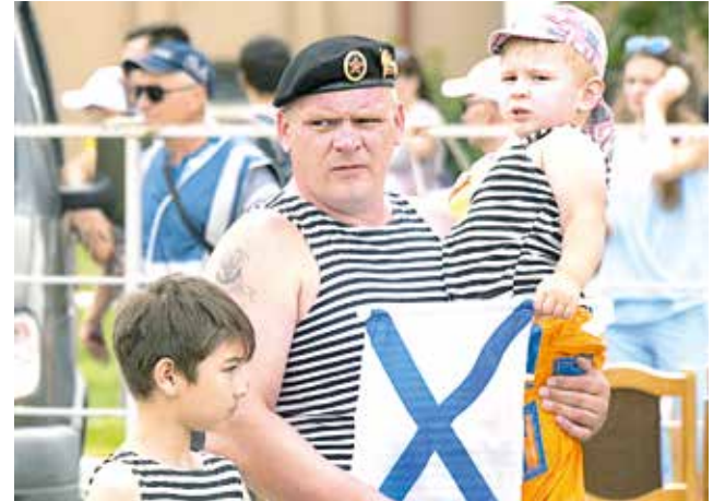
День Военно-Морского флота - один из любимых праздников астраханцев. На него приходят целыми семьями.